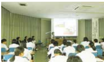
実施学校：鯖江高校

協力企業等：福井大学国際地域学部・工学部、TRYBOTS、オーデオテック、ニカフクイ(株)、福井県農業試験場、(有)アーキズム建築設計事務所、日華化学(株)、福井県立大学、大学院生物資源研究科