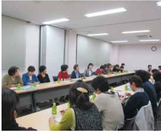
女性町議員と婦人会との懇談会