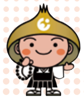
えい坊くんも来るよ！