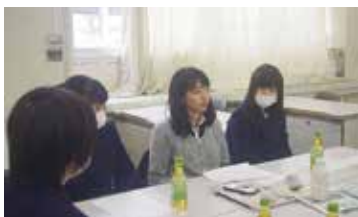
実施学校：羽水高校