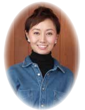
2015年10月に若年性乳がんを告知され、16年5月摘出。18年5月に自身のヨガスタジオを開設予定。

一つ目は自分で自分のことをあきらめないことです。自分が満たされていないと不満が出てきて相手に寛容になれません。自分の考えと他人の考えを比べないようにしています。