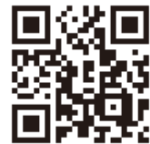
↑ 視聴はこちらから ↑

ふくい女性活躍支援センターと相談室は福井県生活学習館より業務委託を受けています。