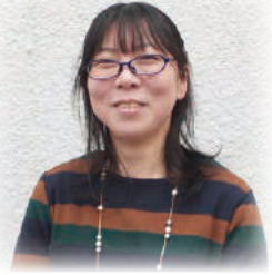
東京都出身。あわら市にて就農。2児の母。