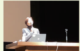
「強さは優しさ 柔道から学んだこと」 講師 山口 香 氏

【事業効果】 本来なら一昨年30周年を迎えましたが、改めて今年度記念大会を開催することで、大会準備を通じ、会員同士でのコミュニケーションが促進されました。同時にネットワークの活性化につながり、30年の歩みの周知と、指導者として道を開いてきた講師の講演を通じて、男女共同参画について関心のなかった市民層への意識啓発も図ることができました。