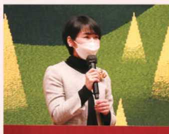
身体に優しいミニ講演会