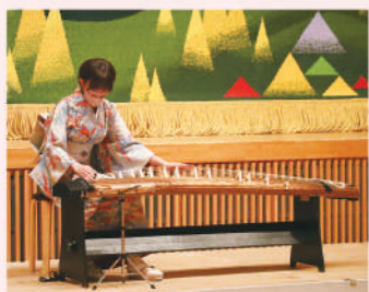
新春にふさわしい箏演奏

個食・黙食・マスク会食によるコロナの感染対 策を施し、短い時間でしたが、一堂に会するこ とができ、皆様にお楽しみいただきました。