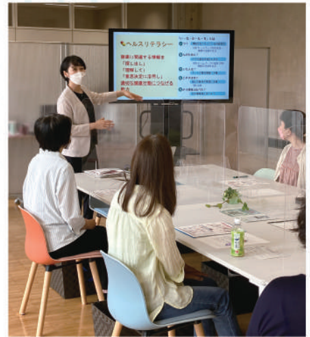
フリートーク前の専門家によるミニ講座も好評です