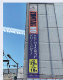
西武福井店前懸垂幕