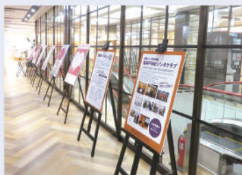
福井FINEゾンタクラブ展示

12月10日(土) 不安や心配ごとを和らげる… 「女性のカラダ～ホルモンバランス、更年期～」