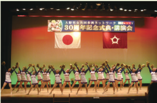
福井県立福井商業高校JETSによる アトラクション