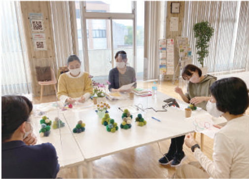
ピアサポーター連携サロン「夕虹の会」

多様なテーマで、今年度は100回を超えるピアサポートサロンが開催できました。サロンは、同じ悩み・似た立場の同士が、少人数で向き合います。最初は少々緊張気味でも、時間が進むにつれ温かい雰囲気の中で、様々な状況や気持ちが吐露されています。静かな会話があれば、時には共感できすぎて互いに大笑い、のような場面も見受けられます。