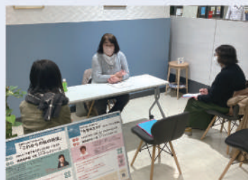
出かけるピアサポートサロン